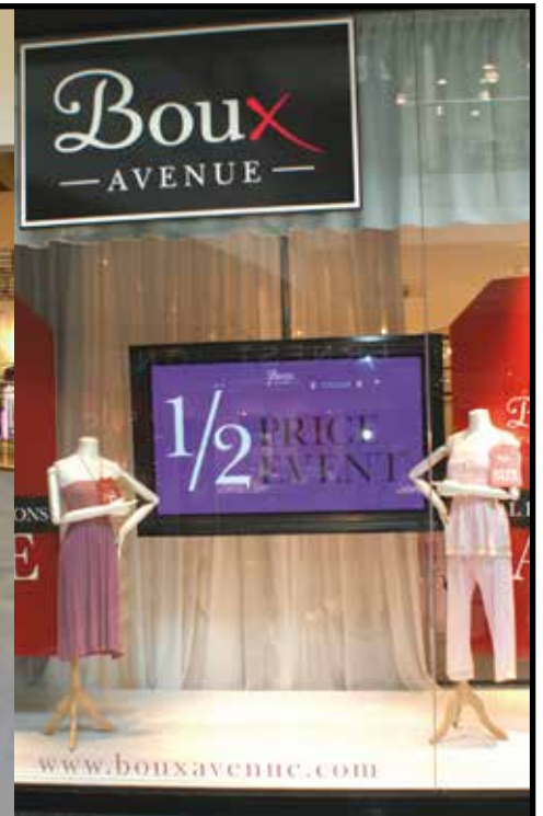
Roller Trak, Rota Mount und 65" Bildschirm