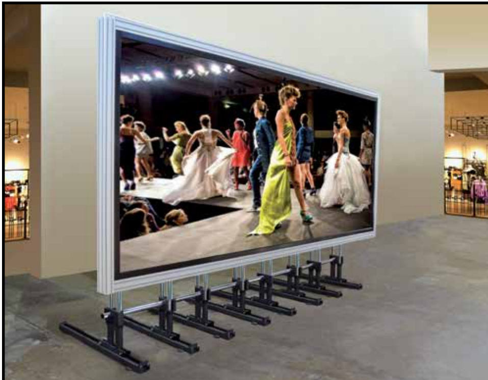
Mehrschienen-System im Test vor dem Einbau