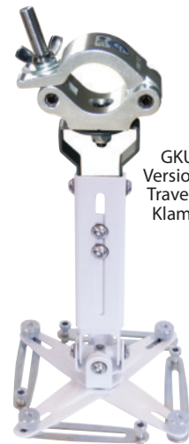
GKUT1 Version mit Traversen- Klammer