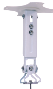
GK0 Version mit Kamera-Schraube